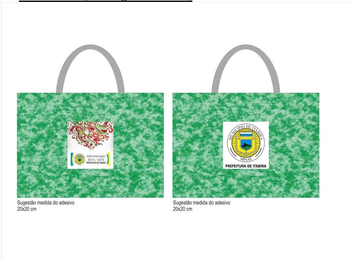
Sugestão medida do adesivo 20x20 cm